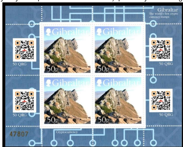
il. 1. Skan arkusika crypto currency stamps wyemitowanego przez Royal Gibraltar Post Office.

Podobnym wydaniem jest Mi10 z Wysp Marshalla z 1 kwietnia 2019 roku (il. 2). Nakład wyniósł 100 000 arkusików, a kod QR pozwalał na odebranie 100 tokenów Mi10 na arkusik ( https://etherscan.io/token/0x32b47d3b4a524f03997e4f069f32fe1518c5c241 )