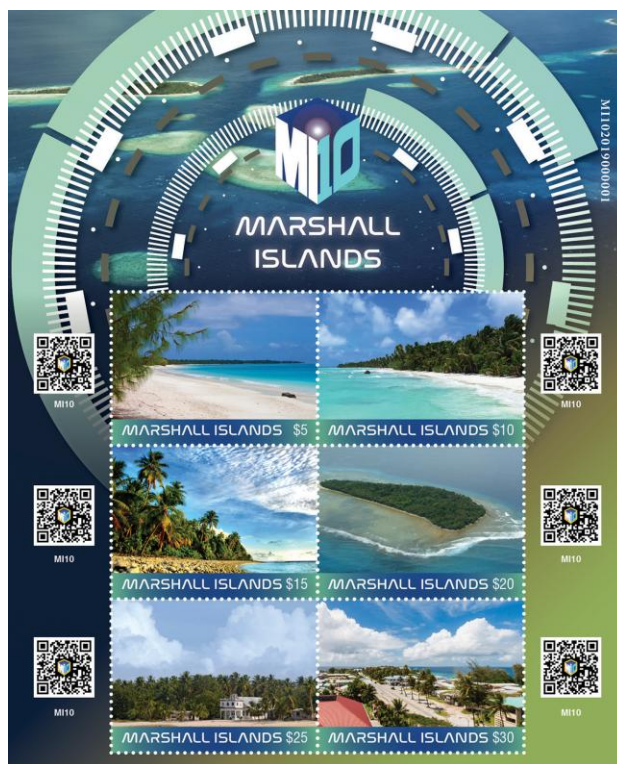
il. 2. Wydanie MI10 Marshall Islands, emisja łączona przez Inter-Governmental Philatelic Corp. oraz Marshall Islands (źródło https://www.stampnewsnow.com/PDF_Pages/IGPC-2020/IGPC-Marshall-Islands-Crypto.pdf ). Wydanie to nie jest zawarte w katalogu https://www.stampworld.com/ , więc nie jest ono wydaniem oficjalnym.